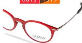
PS 14002 52x17 0001 0003 0039 0041